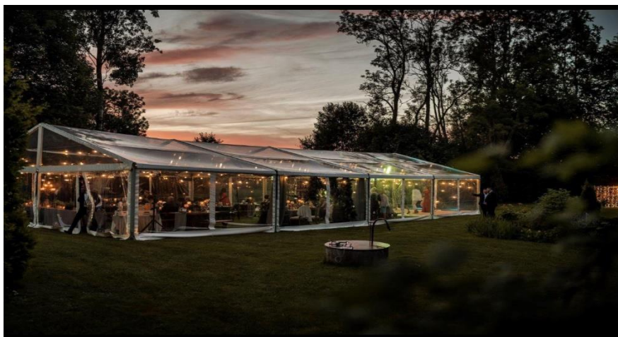
Bildei informatīvs raksturs