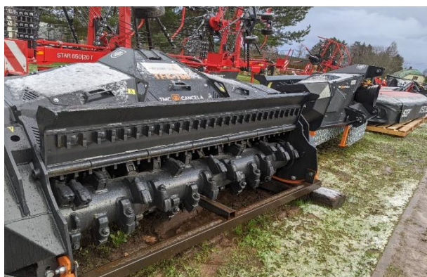
Bildei informatīvs raksturs