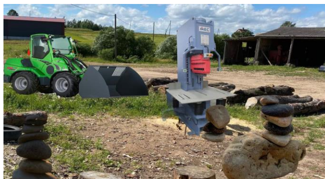
Bildei informatīvs raksturs