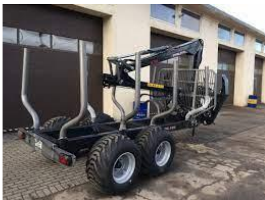
Bildei informatīvais raksturs