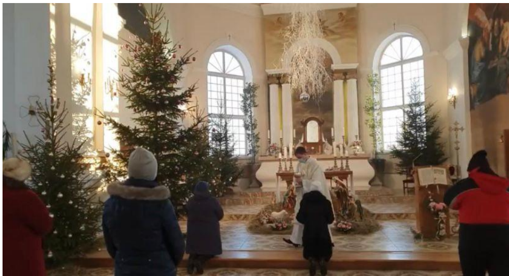
Foto: 25.12.2021. Kristus piedzimšanas svētku mise, Sakramenta pasniegšana

No 2021.gada novembra katru piektdienas vakaru notika vissvētākā sakramenta adorācija ar muzikālo pavadījumu un meditācijām.