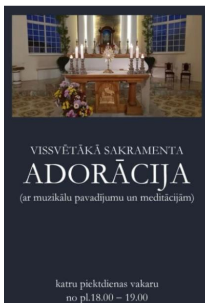
Foto: 07.11.2021.pasākuma reklāmas bilde

No 2021.gada novembra katru piektdienas vakaru notika vissvētākā sakramenta adorācija ar muzikālo pavadījumu un meditācijām.