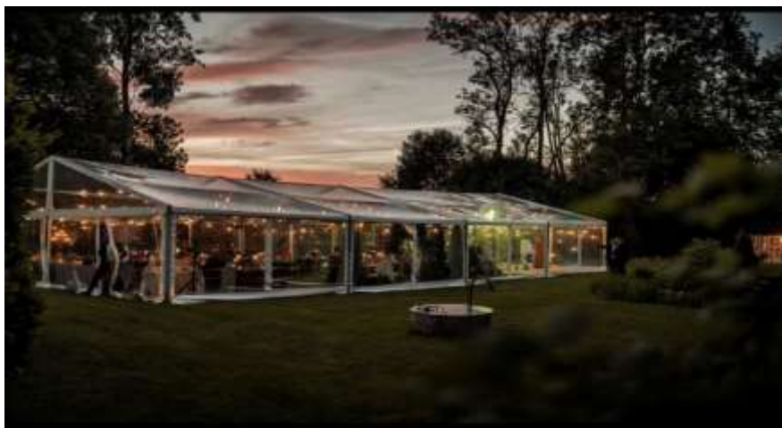
Bildei informatīvs raksturs