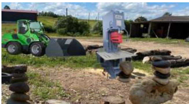
Bildei informatīvs raksturs