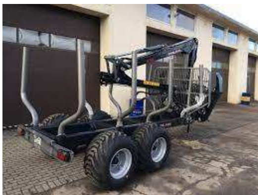
Bildei informatīvais raksturs