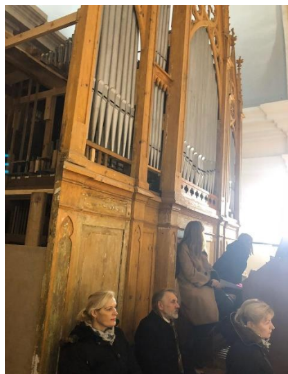
Foto: Ziemassvētku Vigīlijas Sv.Mise

2019.gadā garīgās mūzikas koncerts notika 15.decembrī, pasākumu apmeklēja vairāk kā 100 cilvēki.