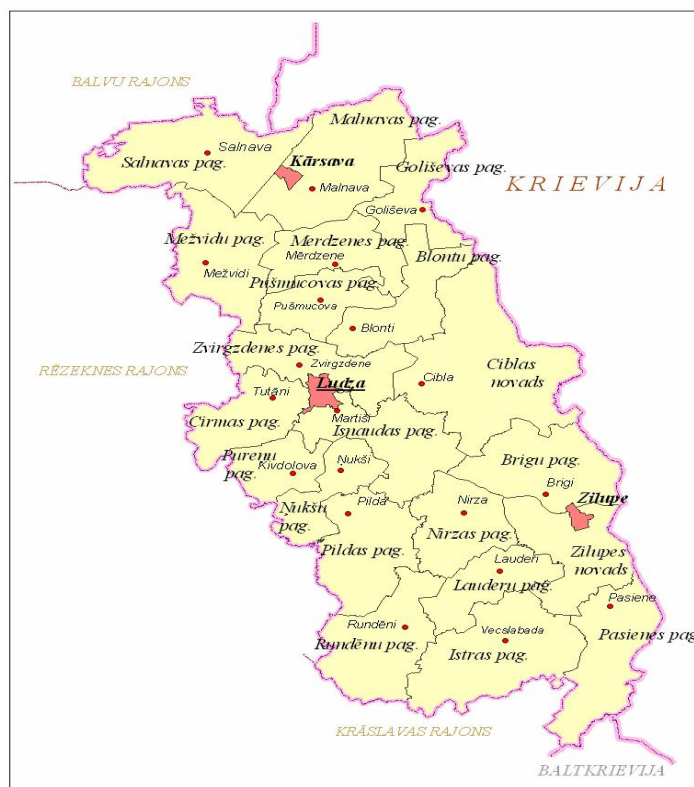
Attēls 2. Ludzas rajona partnerības darbības teritorija: Kārsavas, Ludzas, Ciblas un Zilupes novadi.

Ludzas novada kopējā teritorija aizņem 966 kv.km. Novada administratīvais centrs ir Ludzas pilsēta. Tā atrodas 267 km attālumā no valsts galvaspilsētas Rīgas, 122 km attālumā no Daugavpils un 30 km attālumā no Rēzeknes. Novada teritoriju šķērso valsts galvenais autoceļš A12 Jēkabpils – Rēzekne – Ludza – Krievijas robeža (Terehova), starptautiskās automaģistrāles E22 Rīga – Maskava daļa un dzelzceļa līnija Rīga – Maskava. Ludzas novada teritoriju veido 1 pilsēta - Ludza un 9 pagasti - Brigu, Cīrmas, Isnaudas, Istras, Nirzas, Nūkšu, Pildas, Pūreņu un Rundēnu.