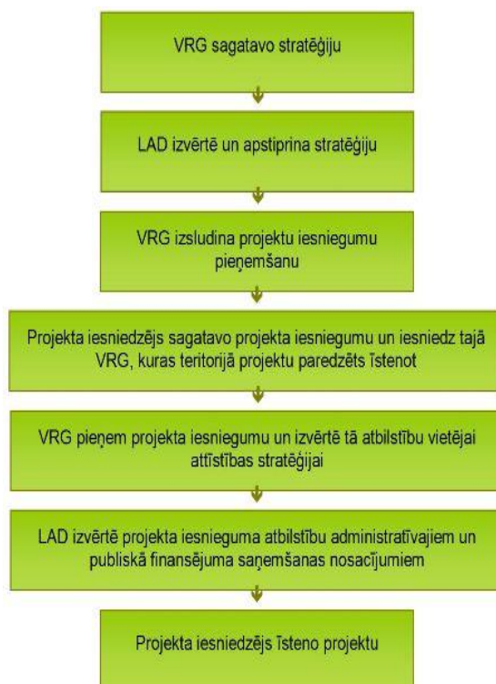
Attēls 3. LEADER pieejas projektu īstenošana

2006. gada 30. jūnijā tika nodibināta biedrība „Ludzas rajona partnerība”. Ludzas rajona partnerība ir biedrība, kurā uz brīvprātības un līdztiesības principiem ir apvienojušās juridiskās un fiziskās personas, kas atbalsta tās darbības mērķi un atzīst statūtus. Ludzas rajona partnerībai nav peļņas gūšanas nolūka un rakstura. Tā darbojas saskaņā ar LR spēkā esošo likumdošanu un statūtiem. Dibinātāji - Ludzas novadu pašvaldību, biedrību un uzņēmēju pārstāvji. Ludzas rajona partnerība pārstāv Ciblas, Ludzas, Kārsavas un Zilupes novadu (bijušā Ludzas rajona) teritoriju iedzīvotājus.